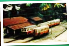
尾小屋駅 増発の臨時列車 (1981)

【尾小屋鉄道】 旅客営業を行う非電化の 軽便鉄道としては 日本国内で最後まで残った路線