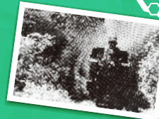
観音下トンネル通過 (1950年代)