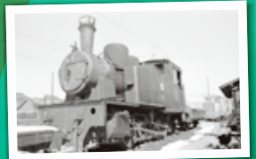
新小松駅 C15 (1970年代)