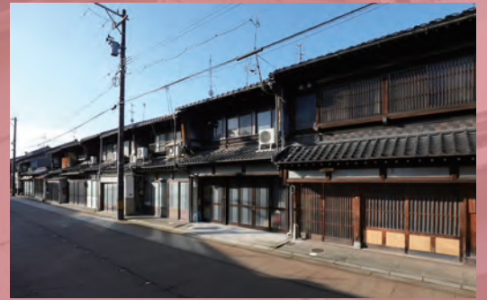
▲町家が建ち並ぶ小松のまちなみ

そんな町家のつくりや生活の様子を体感し、あわせて歴代徳田八十吉の作品をはじめとする九谷焼もお楽しみください。