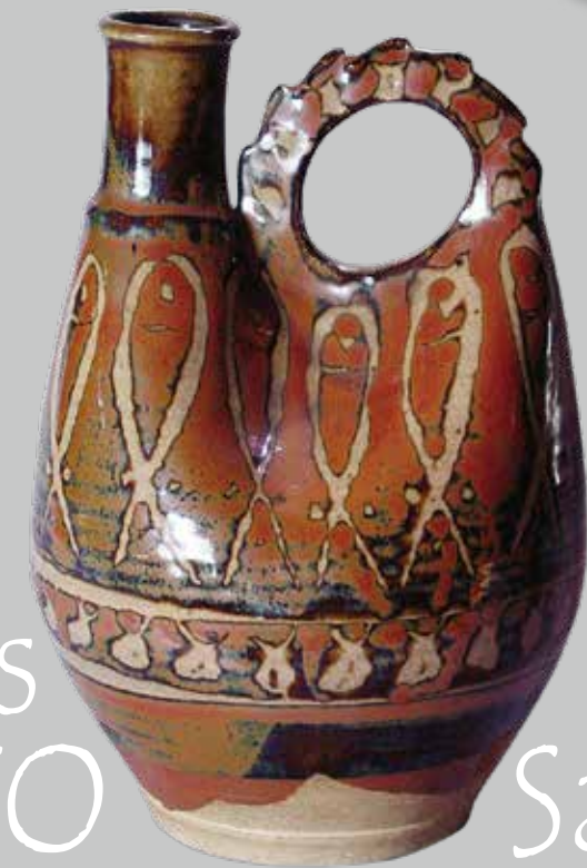
宮本三郎 陶磁器 当館蔵 1.《エイD》制作年不詳 (九谷光仙窯) 2.《蛙》1954年 (九谷須田青華窯) 3.《女神》1955年 4.《裸婦群像》1954年 5.《横向きの女性像》1955年 (大甕陶苑) 6.《水差し》1954年 (大甕陶苑)