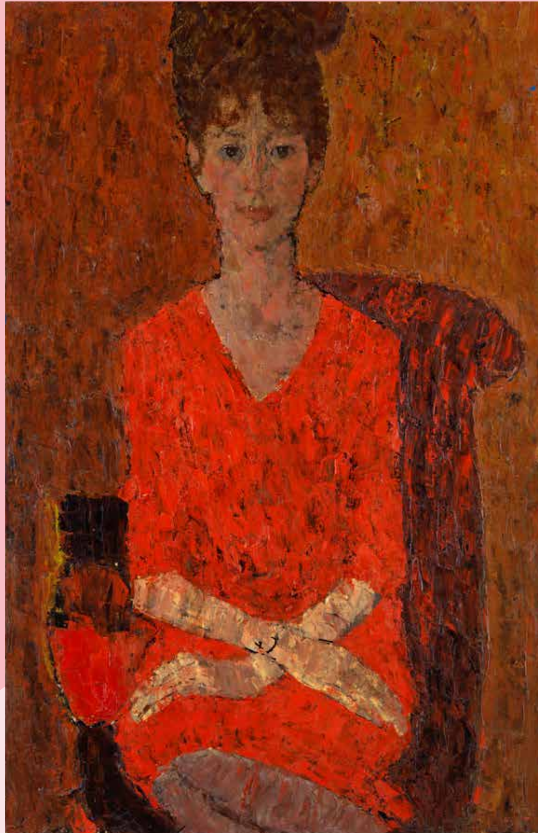
宮本三郎《婦人座像》1961年頃 油彩画 当館蔵