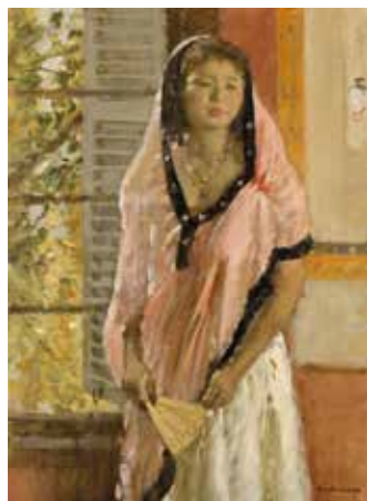
《窓辺の女》油彩画、1945~1948年頃、当館蔵