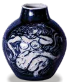
上から 《絵皿「腰かける二人像」》制作年不詳、当館蔵（鳴海製陶） 《絵皿「花飾りの娘」》制作年不詳、当館蔵（大倉陶園） 《小壺「裸婦」》1954年、当館蔵（大甕陶苑）

九谷須田菁華窯で作られた 宮本三郎の絵皿 《蜻蛉》須田菁華窯蔵 《闘牛士》《裸婦》個人蔵