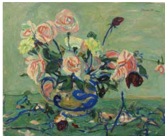
《薔薇など》油彩画、1941年、当館蔵