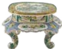
竹林七賢人図木瓜形平卓 粟生屋源右衛門 作 小松市立博物館蔵