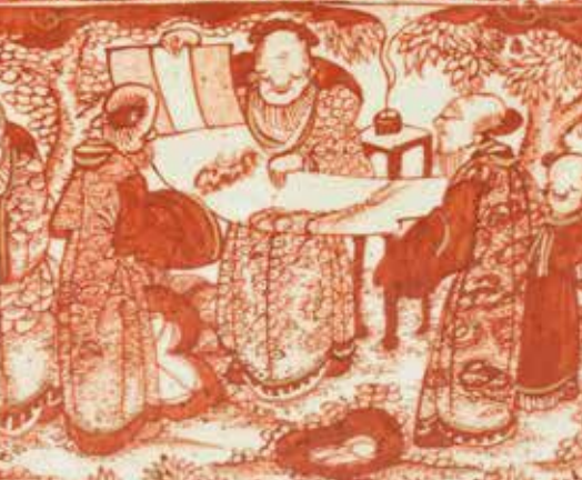
三田焼 赤絵金彩唐人物図角皿（部分） （兵庫陶芸美術館蔵）