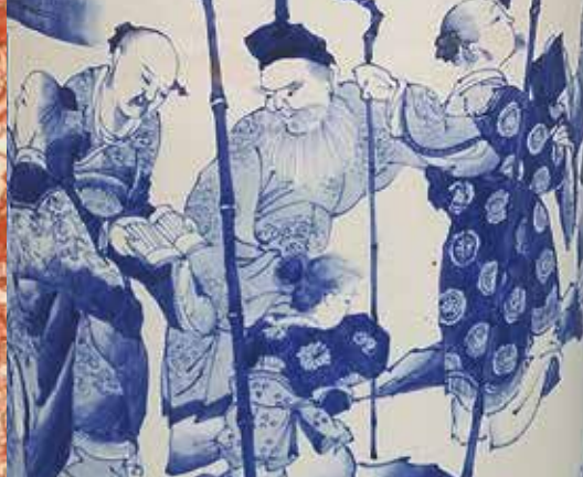
湖東焼 染付竹林七賢人図筒花生（部分） （井伊家伝来 彦根城博物館蔵）