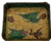
湖東焼 色絵雲鶴文四方形向附 （個人蔵）