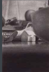
佳作 福濱 美志保 《Night Flight》