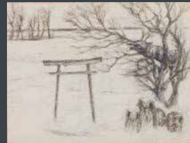
町田久美賞 山内 久 《村はずれのパラダイス》