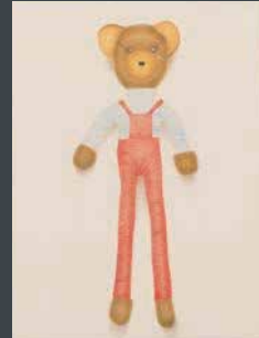
佳作 江波戸 陽子 《僕のくま》