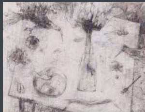
佳作 村田 哲也《鈍色の卓上》