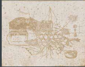
佳作 矢部 史朗 《tribosite 砂の上の足跡》