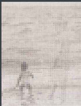
優秀賞 長谷川 正美 《I'll go back to the sea.》